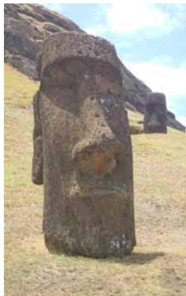
Isla de Pascua