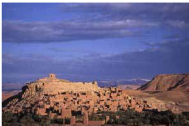
Ait Ben Haddou.

Desviaremos nuestra ruta para visitar el gran palmeral de Skoura, uno de los mayores de la región del Dades y donde podremos visitar alguna de las tradicionales Kasbahs que allí se conservan en muy buen estado. Continuaremos luego para llegar a la kasbah de Ait Ben Haddou, una de las mejor conservadas y mayores del país. Esta kasbah fue declarada en su día patrimonio de la humanidad por UNESCO. Noche en el hotel de Ait Ben Haddou.