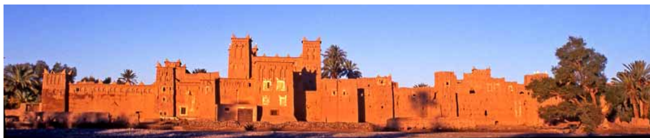
Kasba Ameridil.

Salida por la mañana por carretera para llegar al aeropuerto de Casablanca. Embarque en vuelo de regreso y llegada a Barcelona. Fin del viaje y de nuestros servicios.