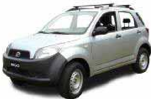
DAIHATSU BEGO o similar