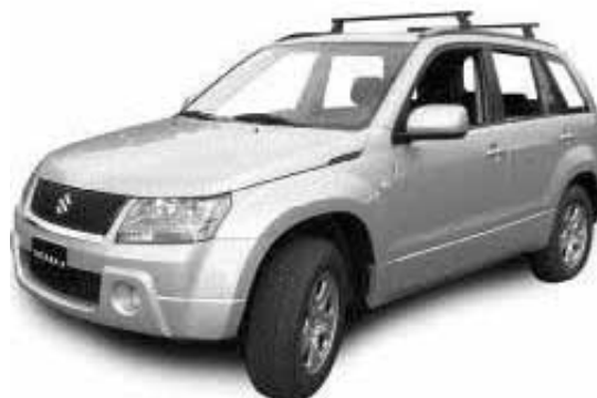
SUZUKI VITARA II o similar