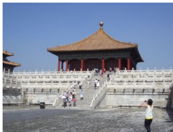
DIA: 3 - Pekín Día libre.

DIA: 2 - Pekín Llegada a Pekín, asistencia en el aeropuerto y traslado al hotel. Resto del día libre. Encuentro con nuestro representante en el hotel y briefing sobre el viaje, así como recomendaciones para hacer en los 2 días libres dentro de la capital china. Pekín es una ciudad con mucho encanto. Se recomienda visitar algunos hutongs o calles típicas, dar un paseo por parques y avenidas, visitar mercados y calles viejas o simplemente descansar. También se puede aprovechar para visitar alguno de los numerosos templos o palacios de la ciudad (consultar con el guía). Por la tarde, existe la opción de ver espectáculos por la tarde (acrobacia, Ópera de Pekín, etc), ir a salones de te o experimentar la medicina tradicional china (masajes, etc.).