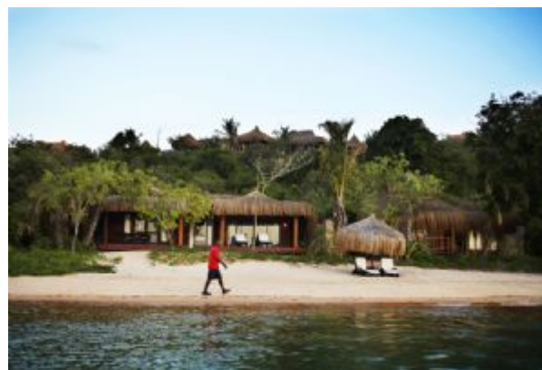
DIA: 14 - Isla de Bazaruto