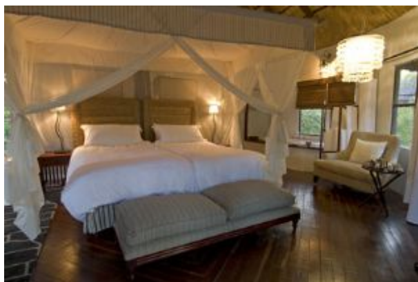
DIA: 9 - Cataratas Victoria