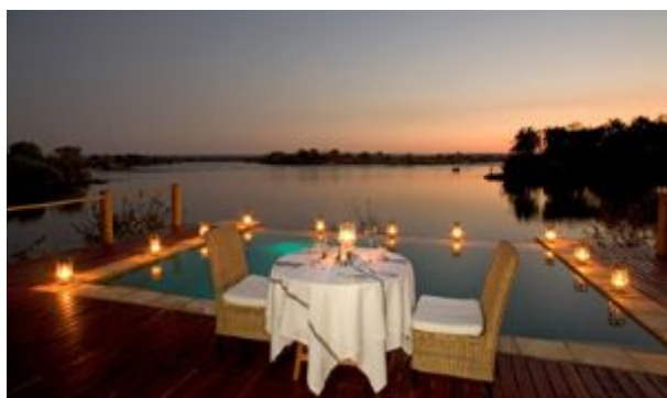
DIA: 10 - Vuelo Livingstone - Johannesburg