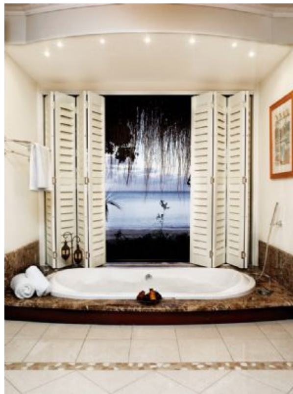
DIA: 15 - Isla de Bazaruto