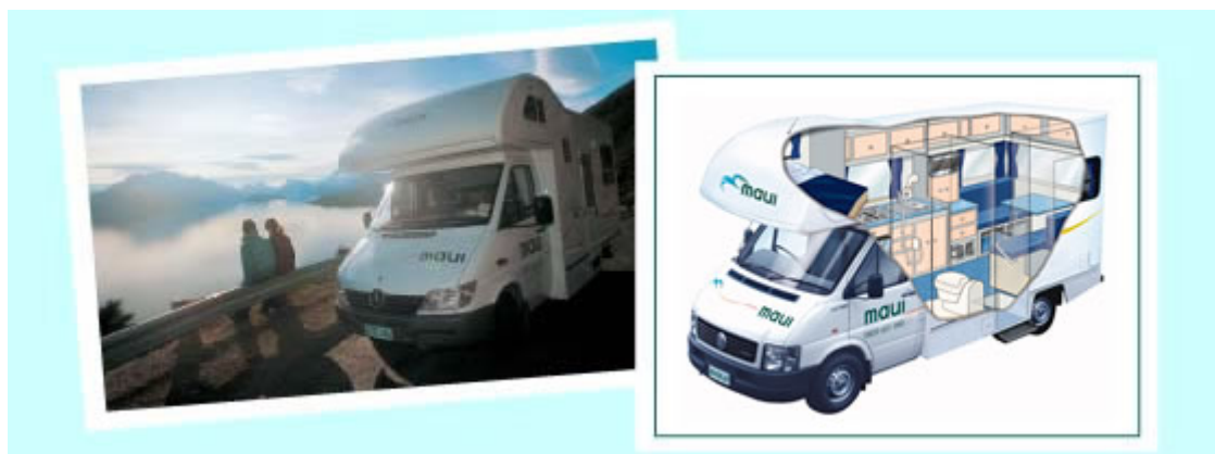
Durante el día en ruta