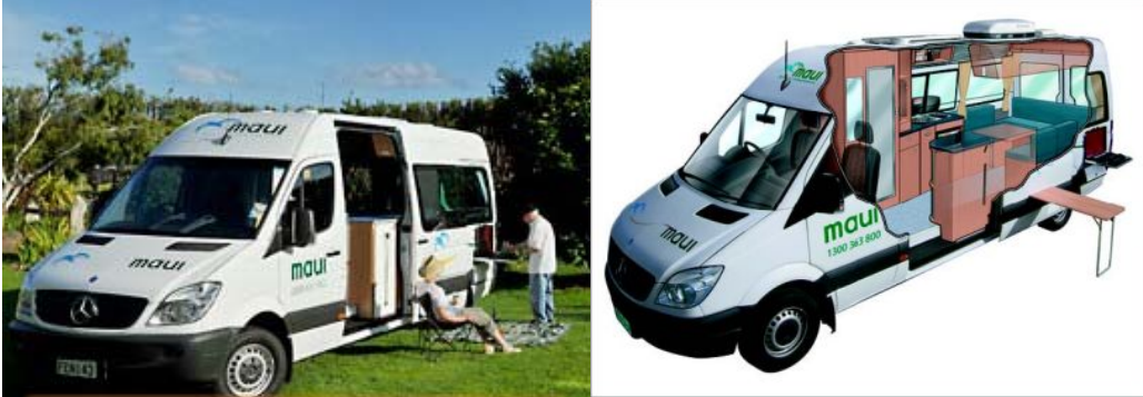
Durante el día en ruta