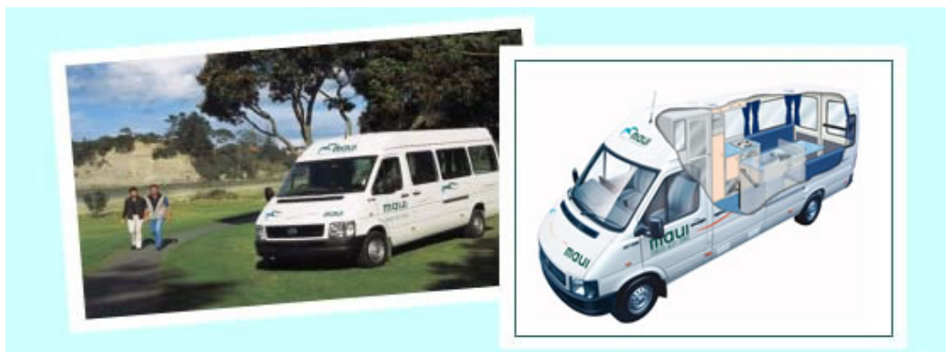
Durante el día en ruta